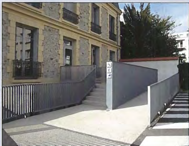
Passage Pilâtre de Rozier. Versailles

Les travaux d'aménagement sont l'occasion de combiner confort thermique, accessibilité et sécurité en vue d'un résultat « durable ». L'adaptation des logements, l'aménagement des établissements recevant du public et de la voirie c'est aussi le maintien d'un tissu économique et social dans les territoires.